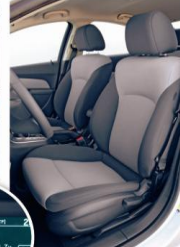
PROFILOWANE FOTELE mają szeroki zakres regulacji, dobre trzymanie boczne i są dość wygodne