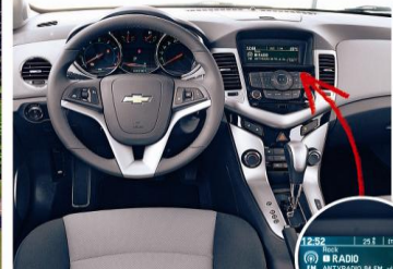
W STYLISCY KOKPITU widać inspirację najnowszym Opel Insignią. Obsługa pokładowych urządzeń nie sprawia problemów. Duży ciekłokrystaliczny wyświetlacz to standard w wersji LT