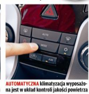
AUTOMATYCZNA klimatyzacja wyposażona jest w układ kontroli jakości powietrza