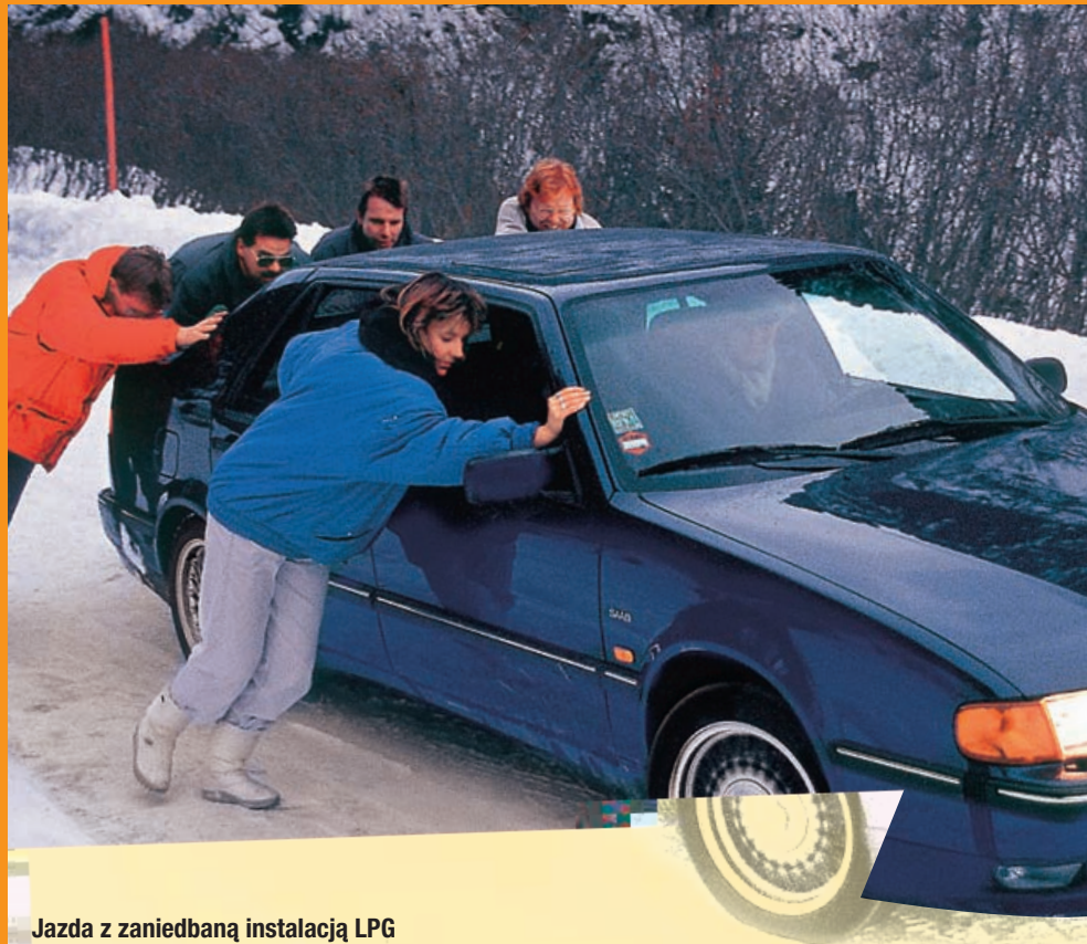
Jazda z zaniedbaną instalacją LPG prędzej czy później tak się kończy. Usterki mogą być poważne